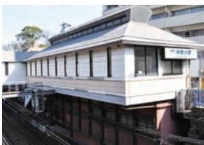
清水の舞台をイメージした、神奈川駅駅舎。

神奈川駅周辺はかつて東海道の神奈川宿として栄えた町。一帯の旧東海道沿いは「神奈川宿歴史の道」として整備されていて、ガイドパネルを見ながら歴史散歩が楽しめる。 ◆ 神奈川駅駅舎 も、1992 (平成4) 年の改築時には「歴史の道」にちなんで清水の舞台をイメージしたものとなったそう。どこが清水寺? と思ったが、青木橋からホームを見下ろすと納得。駅舎下に懸造の柱がデザインされていた。 駅からすぐの宮前商店街は旧東海道。商店街中程の 洲