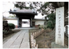
▶ 横浜市神奈川区高島台1-2