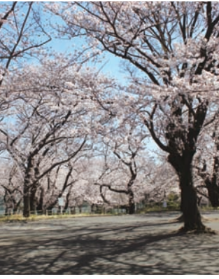
桜の季節の幸ヶ谷公園 (2013年3月撮影)。

散歩の終わりは、以前から車窓から見える看板が気になっていたサカタのタネ直営店、 ガーデンセンター横浜 へ。きれいな季節の草花にテンションが上がリ店に入ると、おしゃれな雰囲気「GREEN BONDS CAFE yokohama」があったので、一休み。そして新鮮な野菜や横浜生まれの加工品を売る青果売り場「サカタマルシェ」でお土産を買って、帰りの電車に乗った。昔この辺りを行交った旅人や外国人の姿に思いを馳せる一日だった。