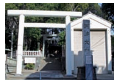
▶ 横浜市神奈川区青木町5-29