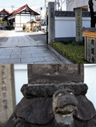
“浦島寺” 慶運寺 (上)。 石碑の台座は何と亀! (下)。

神奈川駅周辺はかつて東海道の神奈川宿として栄えた町。一帯の旧東海道沿いは「神奈川宿歴史の道」として整備されていて、ガイドパネルを見ながら歴史散歩が楽しめる。 ◆ 神奈川駅駅舎 も、1992 (平成4) 年の改築時には「歴史の道」にちなんで清水の舞台をイメージしたものとなったそう。どこが清水寺? と思ったが、青木橋からホームを見下ろすと納得。駅舎下に懸造の柱がデザインされていた。 駅からすぐの宮前商店街は旧東海道。商店街中程の 洲