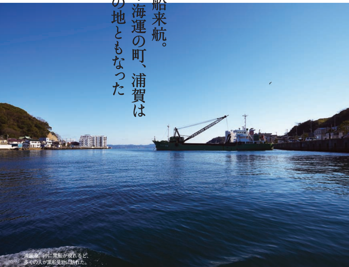
浦賀港。沖に黒船が現れると、多くの人が黒船見物に訪れた。

異国船来航以前、浦賀は肥料の干鰯を扱う干鰯問屋が立ち並ぶ港町であった。江戸初期に建設された和式灯台の燈明堂は、港に出入りする船の安全を守るためのものであり、ペリーも来航時に航行の目安とした。