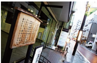
土蔵相模跡 ▶ 品川区北品川1-22-17 ▶ 北品川駅から徒歩3分(旧東海道 北品川本通商店街沿い)

1863（文久2）年、品川御殿山に新たに建設中の英国公使館を、長州藩の高杉晋作、久坂玄瑞、井上聞多（馨）、伊藤俊輔らが襲撃。高杉らは品川宿の妓楼、土蔵相模に集結した後、御殿山に向かった。土蔵相模は、井伊直弼襲撃のため桜田門外へと向かう水戸浪士たちが集結した場としても知られている。