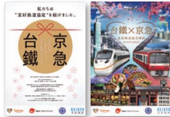
協定締結を記念して 掲出したポスター。

鉄は、訪日台湾人の方々にとって、徐々に身近な鉄道となっています。両者はともに1948年に設立され、河津桜の観光名所をもつなど共通点も多くあります。これを契機に各種取組みを通じ、日台間の交流人口の増大を目指してまいります。